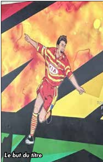
Le but du titre