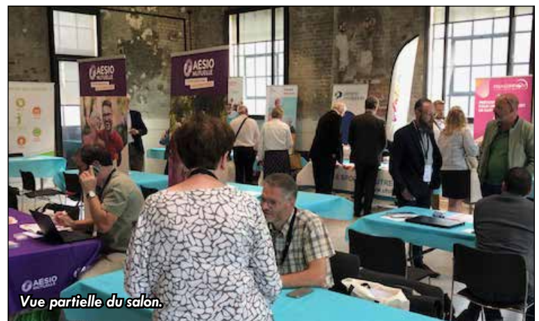
Vue partielle du salon.

Prochaine parution de votre journal MERCREDI 28 JUN 2023