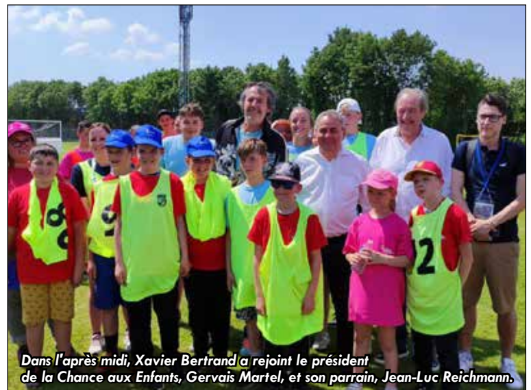
Dans l'après midi, Xavier Bertrand a rejoint le président de la Chance aux Enfants, Gervais Martel, et son parrain, Jean-Luc Reichmann.