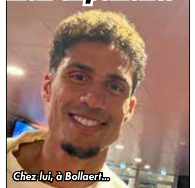
Chez lui, à Bollaert...

« Les stages sont une façon de transmettre mon expérience, et de rendre à travers le sport tout ce que j'ai appris, de partager des valeurs, le travail, le respect, l'humilité, l'ambition qui m'ont profité pendant toutes ces années au plus haut niveau » explique le défenseur central mancupien. « C'est aussi faire quelque chose de différent et personnalisé, avec des stages éducatifs qui abordent beaucoup de thématiques, mixtes, ouverts à tous ».