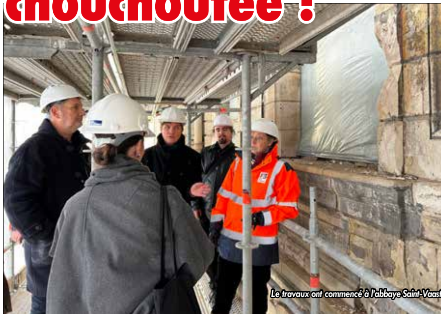
Le travaux ont commencé à l'abbaye Saint-Vaast

Les autres grands projets inscrits pour 2024 : la rénovation de la toiture de l'hôtel de ville, la délocalisa-