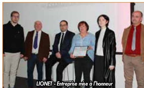
LIONET - Entreprise mise à l'honneur