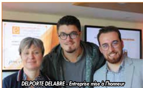
DELPORTE DELABRE - Entreprise mise à l'honneur