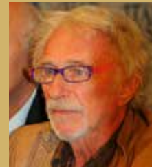
Pierre Richard 16 août 1934 à Valenciennes

Soyez prêts à explorer de nouvelles aventures et à prendre des initiatives audacieuses dans tous les aspects de votre vie. N'ayez pas peur de briller et d'inspirer les autres. En restant fidèles à vos valeurs, vous transformerez cette année en une épopée de succès et d'épanouissement.