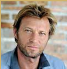
Laurent Delahousse 30 août 1969 à Croix

La Balance naviguera à travers 2024 en recherchant l'harmonie dans tous les aspects de sa vie. Soyez ouverts aux opportunités d'apprentissage et de connexion avec les autres. Utilisez votre sens inné de la diplomatie pour résoudre les conflits et créer une atmosphère positive autour de vous. En cultivant l'équilibre, l'année 2024 sera une période de succès.