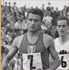
Michel Jazy 13 juin 1936 à Oignies