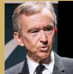
Bernard Arnault 5 mars 1949 à Roubaix

autres et explorez les expressions créatives de votre être. En embrassant votre sensibilité et en écoutant votre voix intérieure, vous vivrez une année de croissance, de reconnexion et de découvertes.