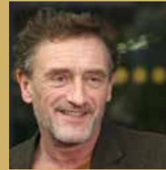
Jean-Paul Rouve 26 janvier 1967 à Dunkerque

vos ambitions avec patience, vous réaliserez des progrès significatifs dans tous les aspects de votre vie. Faites preuve de confiance en vous et restez fidèle à vos principes, et cette année vous sera profitable.