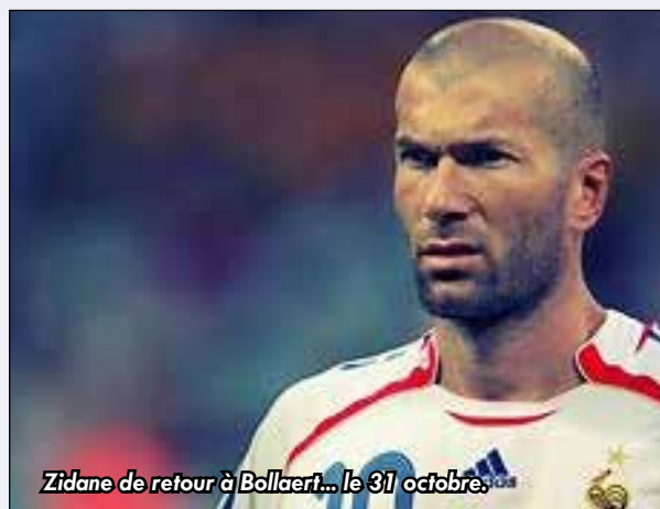
Zidane de retour à Bollaert... le 31 octobre.

✓ Tarif : de 10 à 35 €. 25% de réduction pour les moins de 16 ans. Billetterie en ligne sur rclens.fr .