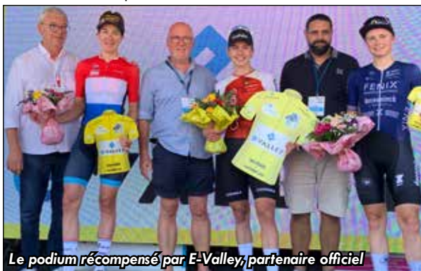
Le podium récompensé par E-Valley, partenaire officiel