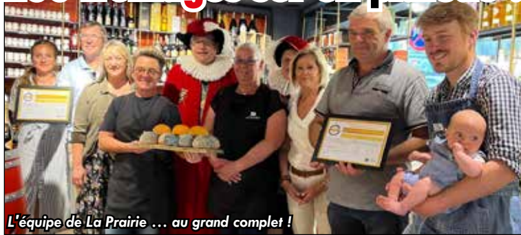
L'équipe de La Prairie ... au grand complet !