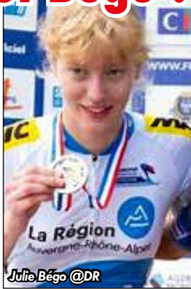
de la course, à nous d'en tirer profit » prévient le directeur sportif.

Les organisateurs sont bénis des dieux pour cette 2 e édition. Outre des équipes World Tour comme AG Insurance, Fenix-Deceunick, Ceratizit ou encore Israel Premier Tech, et les équipes françaises St-Michel Auber 93 et Arkéa, Cofidis prendra le départ de Brebières avec de réelles ambitions.