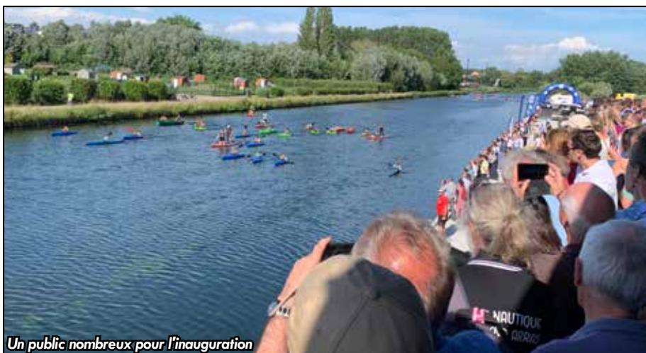
Un public nombreux pour l'inauguration