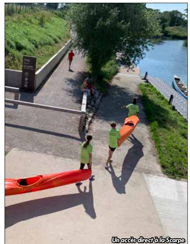
Un accès direct à la Scarpe