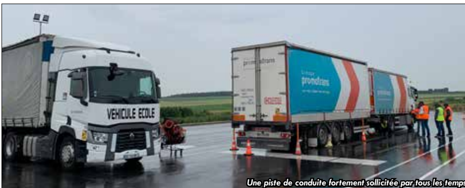
Une piste de conduite fortement sollicitée par tous les temps