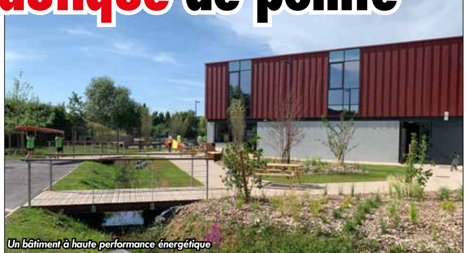
Un bâtiment à haute performance énergétique

Le stade nautique, qui a déjà la certitude d'accueillir une délégation de la fédération ouzbègue de canoë-kayak pour sa préparation aux JO de Paris, a été pensé en collaboration avec les athlètes et les techniciens de la discipline. « On a vu plein de stades dans le monde. C'est un peu le fruit de tout cela tout en s'adaptant à notre site et à notre spécialité, la course en ligne » commente Olivier