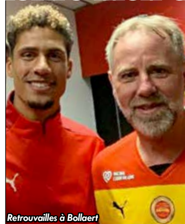
Retrouvailles à Bollaert

« Les stages sont une façon de transmettre mon expérience, et de rendre à travers le sport tout ce que j'ai appris, de partager des valeurs, le travail, le respect, l'humilité, l'ambition qui m'ont profité pendant toutes ces années au plus haut niveau » explique le défenseur central mancupien. « C'est aussi faire quelque chose de différent et personnalisé, avec des stages éducatifs qui abordent beaucoup de thématiques, mixtes, ouverts à tous ». Les stages sont organisés ici dans les Hauts-de-