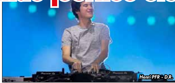
Henri PFR - D.R.

« C'est un long chemin d'auto-risitions. C'est un site historique qui appartient au Département, donc on ne peut pas faire tout ce qu'on veut. Ensuite il y a toute la partie communication, le budget qu'on allait y consacrer. L'idée c'était vraiment de faire une com fun. Parler aussi qu'on propose un festival à un prix abordable. On a également mis en place, dans une idée d'être éco-res-