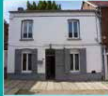
Arras (arrière gare)