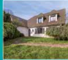
Beaumetz les Loges