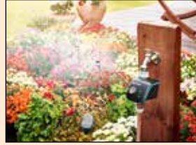
Arrosage automatique : ©Gardena Arrosage : ©Manfredsky-stockadebe.com

Depuis trois ans, le marché de l'arrosage réalise de belles performances. Conserver un jardin vert sans gaspiller l'eau est un challenge désormais accessible.