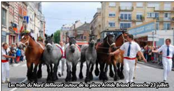
Les Traits du Nord défilent autour de la place Aristide Briand dimanche 23 juillet.