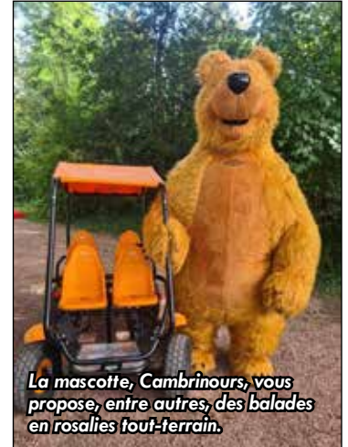
La mascotte, Cambrinous , vous propose, entre autres, des balades en rosalies tout-terrain.

Des événements gratuits ponctuels : La ferme au jardin des grottes et ses 30 animaux (dimanche 16 juil-