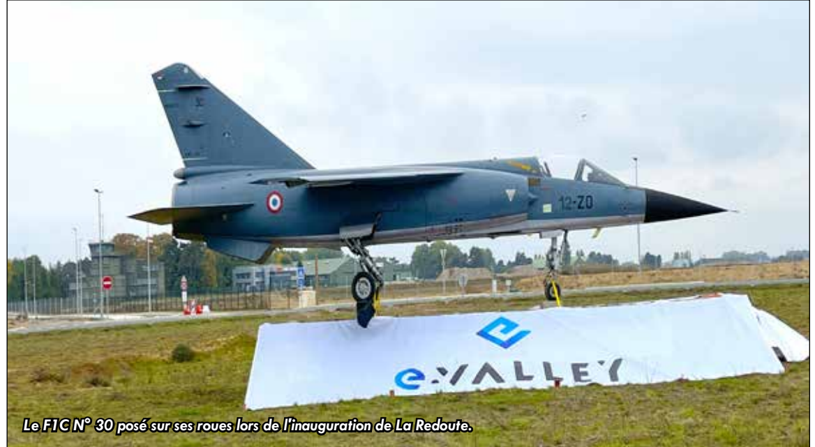
Le FIG N° 30 posé sur ses roues lors de l'inauguration de La Redoute.

Mais à force de questionnement auprès du service du patrimoine et de