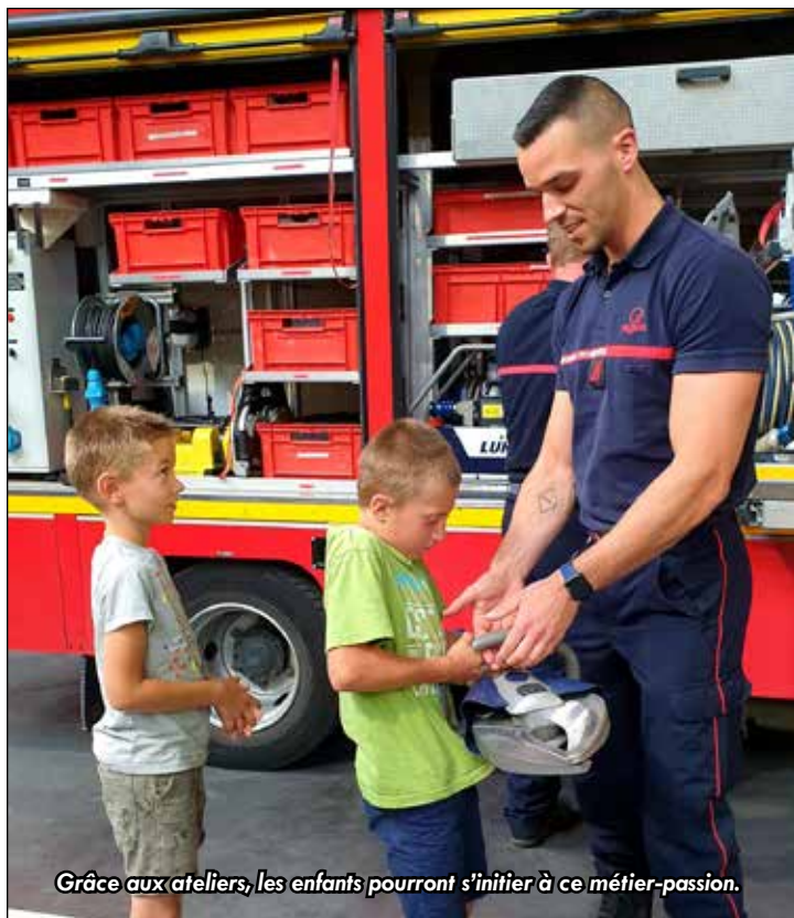
Grâce aux ateliers, les enfants pourront s'initier à ce métier-passion.

✓ Centre Epide, ancienne caserne mortier, rue Louis Blériot à Cambrai