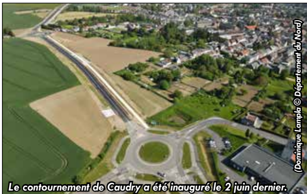
Le contournement de Caudry a été inauguré le 2 juin dernier.

Les travaux ont été financés par le Département du Nord (7,6 millions d'euros), par la Communauté d'agglomération du Caudrésis-Catésis (800 000 €), par la commune de Caudry (800 000 €). La piste cyclable bidirectionnelle est subventionnée par l'État dans le cadre de l'appel à projets "Fonds Mobilités Actives" à hauteur de 400 000 €. Pour l'ensemble du chantier, 3 533 heures d'insertion ont été réservées aux personnes éloignées de l'emploi. ■ M.J.