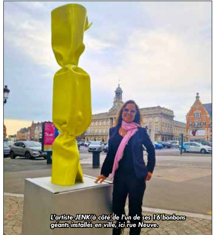
L'artiste JENK à côté de l'un de ses 16 bonbons géants installés en ville, ici rue Neuve.

Classée parmi les artistes français les plus vendus aux États-Unis, JENK est également dans le top 1000 des artistes contemporains internationaux les plus vendus aux enchères ces 20 dernières années dans le monde. Les œuvres de JENK sont exposées dans plus de 50 pays. Des couleurs éclatantes, de l'art et de la gourmandise aux allures de bêtises, ici aussi, on adore ! ■ M.J.